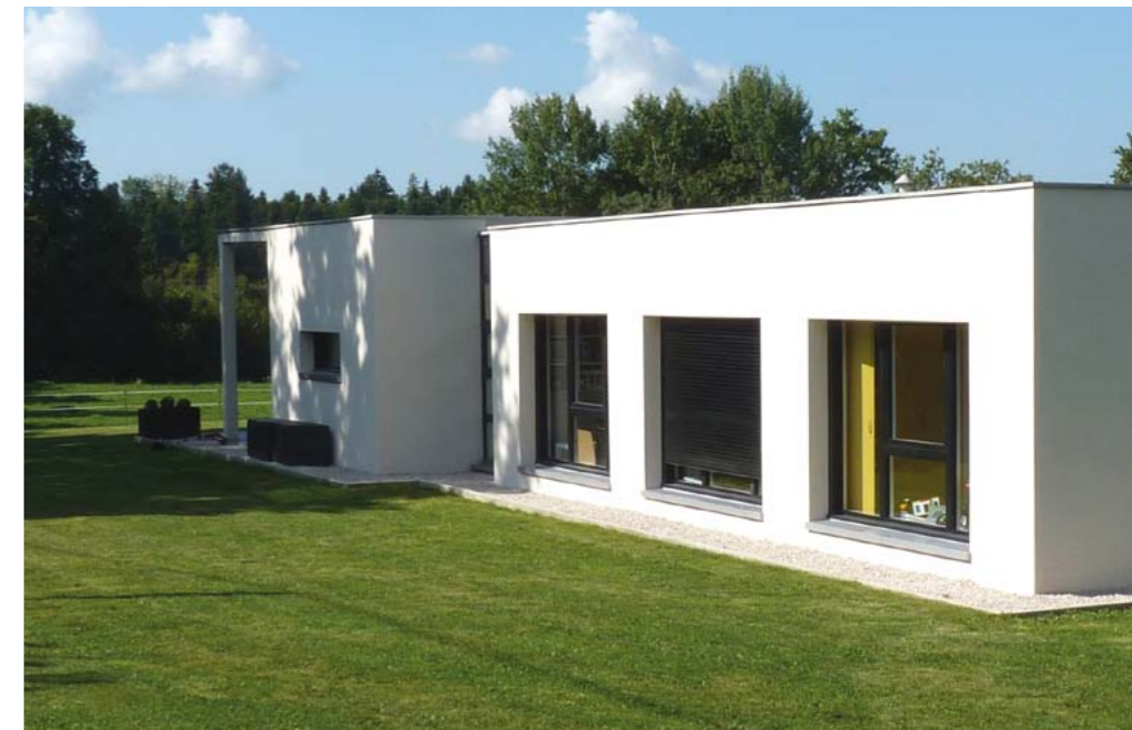
Architecte : Richard Garcia

La réforme du permis de construire, entrée en vigueur le 1 er octobre 2007, en a simplifié les formalités.